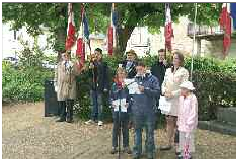
La lecture des messages par deux écoliers