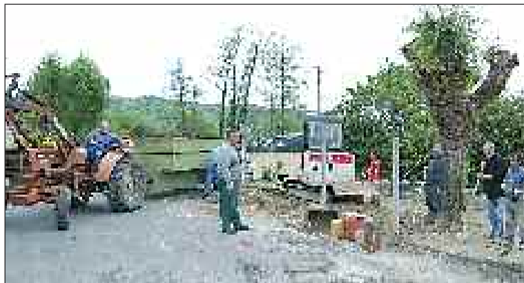
Les bénévoles au travail