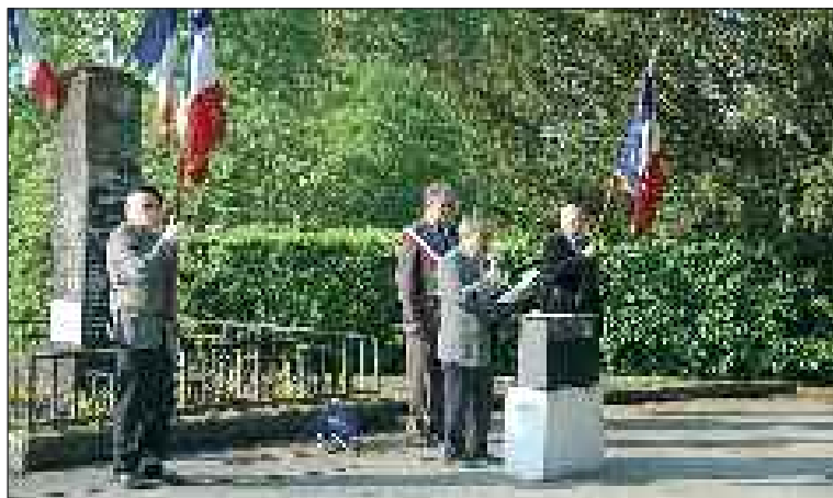
Lors de la lecture des messages