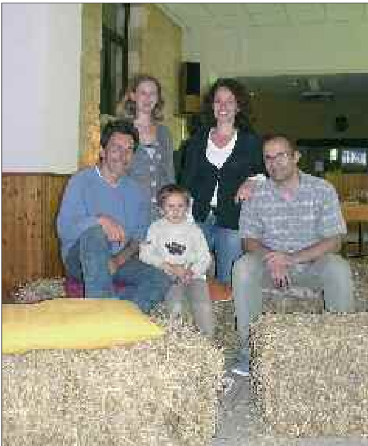
Satisfaction des organisateurs du salon