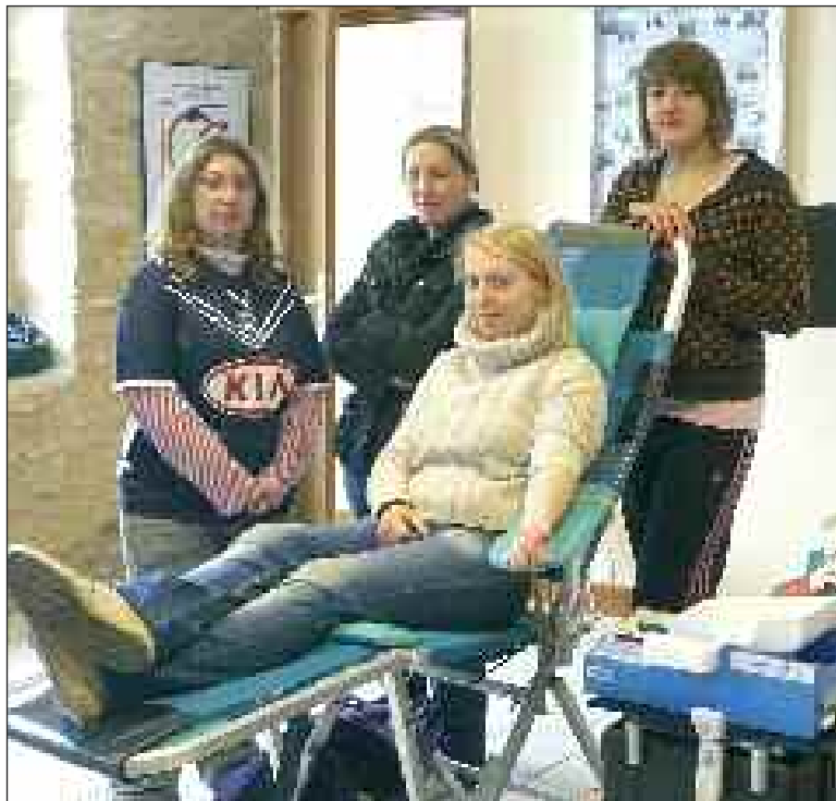
Jeunes filles motivées et généreuses